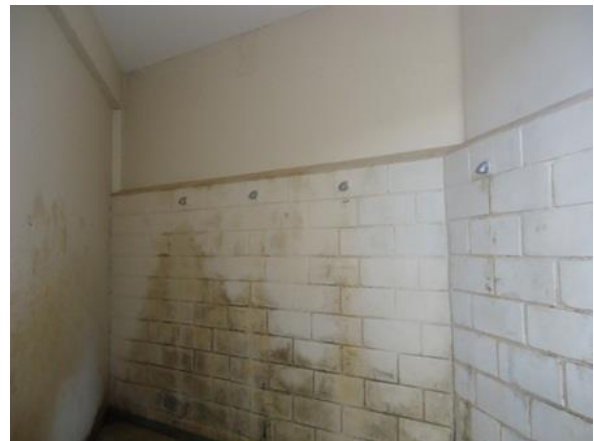
Andar térreo da Unidade 3 (regime semiaberto), em 05/07/15.

Cela de banho do andar térreo do regime semiaberto: De acordo com o projeto original, este era um local destinado a sanitários. Do lado esquerdo da cela de banho, iniciam-se as celas de custódia.