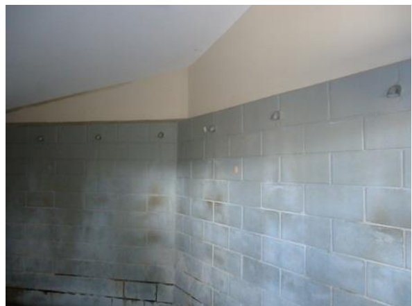
Andar superior da Unidade 3 (regime semiaberto), em 05/07/15.

Cela de banho do andar superior do regime semiaberto: De acordo com o projeto original, este local era denominado “depósito”. Do lado esquerdo da cela de banho, iniciam-se as celas de custódia.